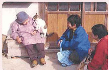
高齢者を地域で見守ります。