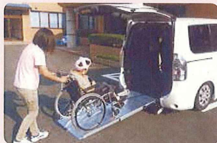
障がい者をサポートします。