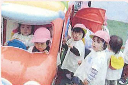
子どもの施設を整備します。