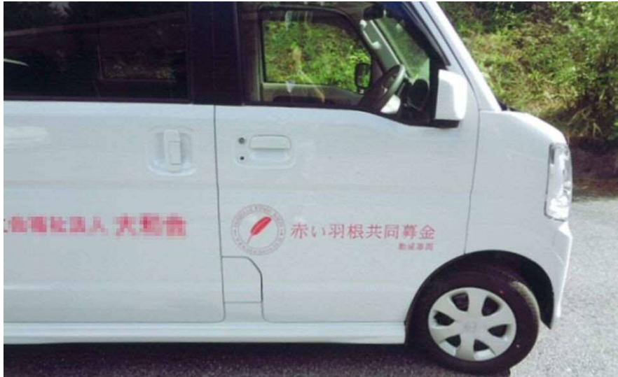
車両デザイン_基本形 A